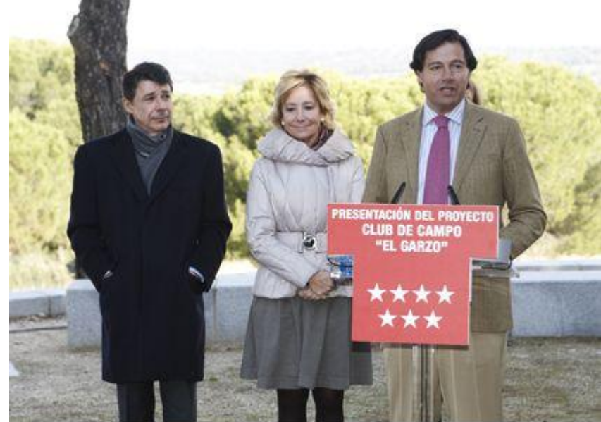
El alcalde en la presentación

Los dirigentes de la Comunidad de Madrid se han convertido en serviles portavoces de un macro proyecto privado, en la finca pública de El Garzo, en el borde urbano de Las Matas, con límites el Monte del Pardo y el ferrocarril de cercanías. Es una actuación de menor escala que Eurovegas, pero en una zona muy sensible desde el punto de vista medioambiental.